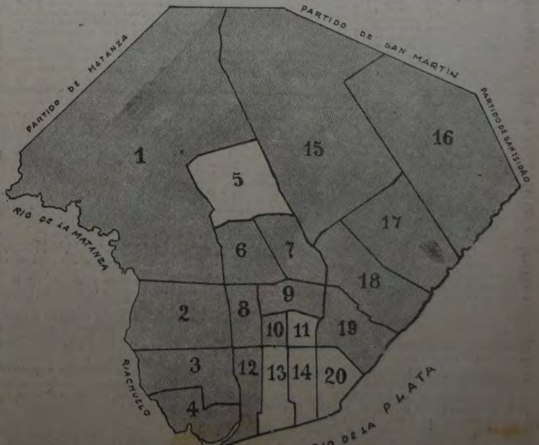
PLANO DE LAS 20 SECCIONES ELECTORALES DE BUENOS AIRES, EN EL QUE LA PARTE GRISADA INDICA LAS SECCIONES EN LAS CUALES HA TRIUNFADO EL PARTIDO SOCIALISTA SOBRE LOS LIBERTINOS, DE ACUERDO A LOS RESULTADOS DEL ESCRUTINIO DE LA ELECCION COMUNAL.